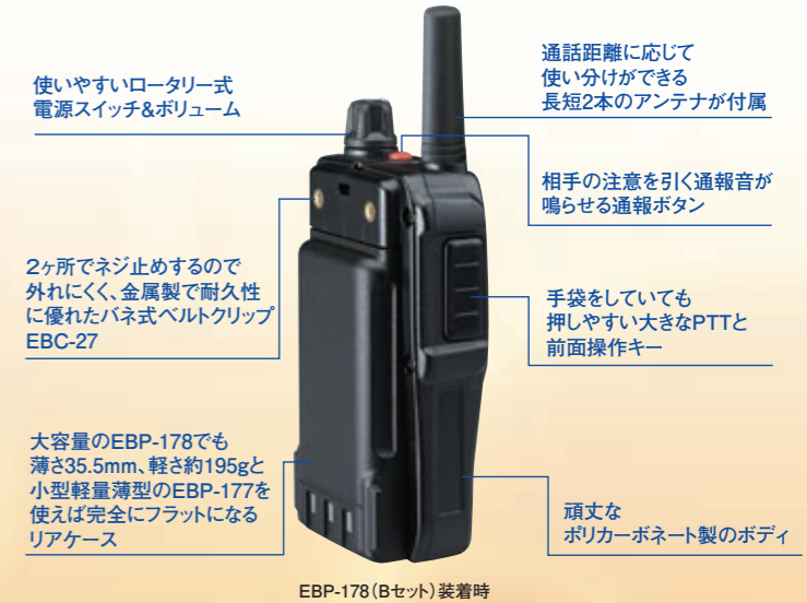
EBP-178 (Bセット) 装着時

【条件】 送信出力ハイパワー 受信音量最大 バッテリーセーブ有効 (無効) 5秒送信、5秒受信、90秒待ち受け