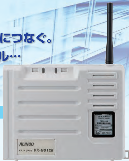
デジタル簡易無線登録局IP無線装置