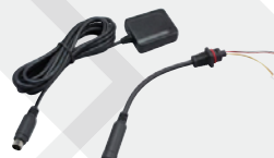
GPSレシーバーキット FGPS-3KIT