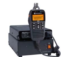
※本体・マイク含まず 直流安定化電源 FP-33