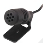
サンバイザーマイク※ GMMN4065