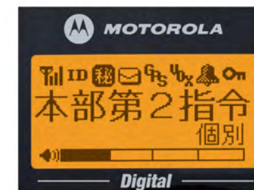
〈ディスプレイ:実物大〉

世界各国で政府機関向けの無線機を供給し、高い評価を得ているモトローラだからこそできる製品(本体)2年保証です。