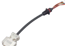
データ通信ケーブル CT-147