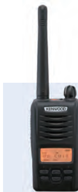
デジタル簡易無線 携帯型登録局対応無線機 D503シリーズ