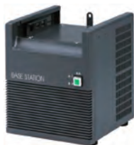
ベース用 スピーカー付き電源 KBS-1